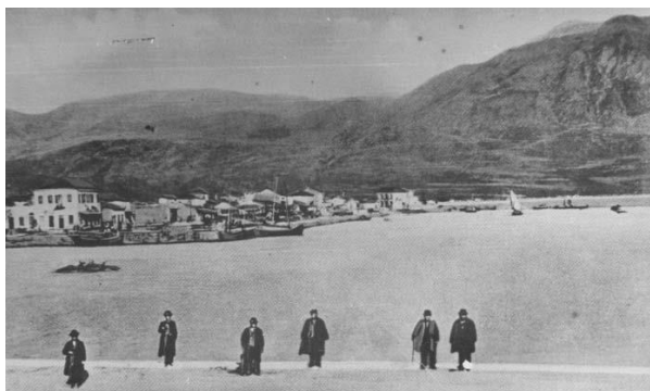
Το λιμάνι της Καλαμάτας, φωτογραφία αγνώστου, αρχές 20ού αιώνα

Με αφορμή την εμπορική δραστηριότητα του λιμανιού της Καλαμάτας, επικεντρωνόμαστε στα ταξίδια των διατροφικών προϊόντων αλλά και των ανθρώπων, επιχειρώντας ένα ταξίδι μνήμης στον χώρο και τον χρόνο. Εστιάζουμε στις μεταφορές διατροφικών προϊόντων και στις αλλαγές που έχουν επιφέρει, ιστορικά, στις ζωές των ανθρώπων: αλλαγές στις διατροφικές συνήθειες, στη διαμόρφωση νέων αναγκών και τρόπου ζωής, σε μεταναστεύσεις, αλλά και ξεσπάσματα πολιτικών και κοινωνικών συγκρούσεων.